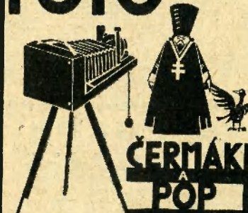
FOTO APARATY POTREBY Fotografujte! Váš aparát je pro Vás připraven.

Dáme Vám na něj stálou záruku a právo bezplatné opravy zdarma.